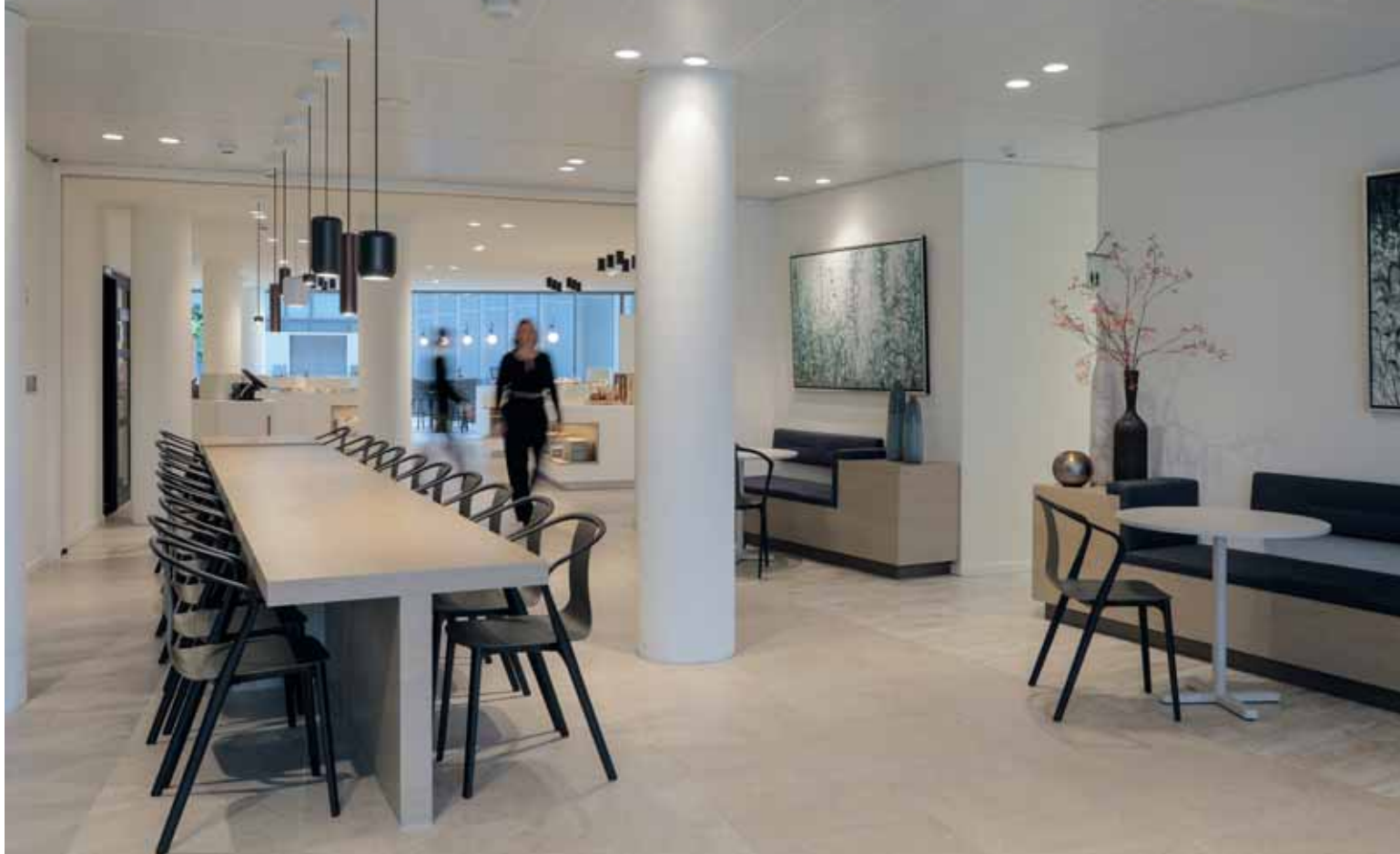
FOTO BOVEN De doorgang van de entree naar het restaurant is opengebroken. Bezoekers kunnen er zowel individueel als groepsgewijs plaatsnemen.

FOTO LINKSONDER De Nespresso-bar heeft een eigen barista en links een speciale water- en theebar. Deze extra voorzieningen ontstonden op speciaal verzoek van de medewerkers.