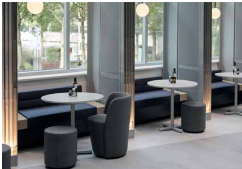
FOTO MIDDEN In het restaurant kunnen medewerkers groepsgewijs aan lange tafels eten of meer privé aan het raam. Niveauverschillen in de vloer versterken de levendigheid.

met ingefreesde, eikenhouten panelen, afgewerkt in een grijze kleurlak. Diverse soorten kunststof (Corian en Krión), tegels, hout, metaal en meubelbekleding verbeteren de akoestiek en zorgen voor een aangename levendigheid. De natuurlijke tinten in de meubelen, vloerbedekking en verlichting verhogen dit effect. Gebruiksvriendelijkheid én levendigheid worden versterkt door de asymmetrische vorm van de uitgifte-eilanden, de meterslange groepstafels, de niveauverschillen in de vloeren, de privézitjes langs de wanden en de weelderige planten. De enkele kassa is vervangen door drie kassapunten zodat lange wachtrijen tot het verleden behoren. De Leeuw: “Het restaurant en de espressobar zijn een echt sociaal